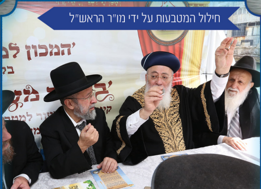
חילול המטבעות על ידי מו"ר הראש"ל